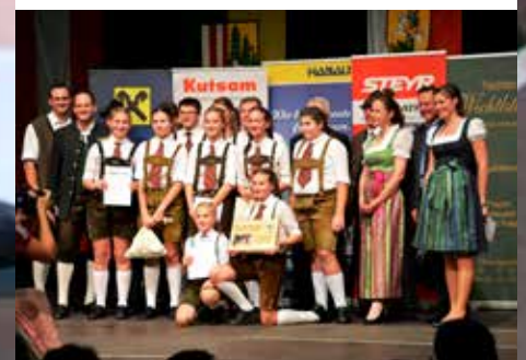
Gemeinsam reiste die Plattlerjugend – alles Mädchen – mit den „Bockleder-Tretern“ und begleitet

Es waren sensationelle Auftritte der Trauner Kinder-Schuhplattlergruppe bei der Veranstaltung „Voigas plattln“ in Frankenburg, bei den Oktoberfesten in Hörsching und Wilhering, und sie unterstützte bei manchen Schiffs-Acts die „Bockleder-Treter“. Die Kindergruppe verstärkte den HTV Traun auch kräftig beim Trachtenumzug durch Linz, zur Eröffnung des Urfahrner Herbstmarkts 2017.