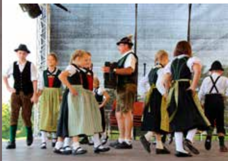
Das zahlreiche Publikum vor der Veranstaltungsbühne im Schlosspark

Bei herrlichem Wetter boten die Kindertanzgruppe des Trachtenvereins „D' Garstnertaler“ aus Windischgarsten, die „Pfarrwanger Kinderplattler“ aus Pfarrkirchen und Adlwang, die „Steyrtaler Jungplattler“ aus Steinbach an der Steyr sowie die Kinder- und die Jugendtanzgruppe der Gastgeber aus Kremsmünster ein abwechslungsreiches Programm, das von österreichischen Grundtänzen über anspruchsvollere Vorföhrtänze bis zu klassischen Plattlern und solchen mit akrobatischen Hebefiguren reichte.