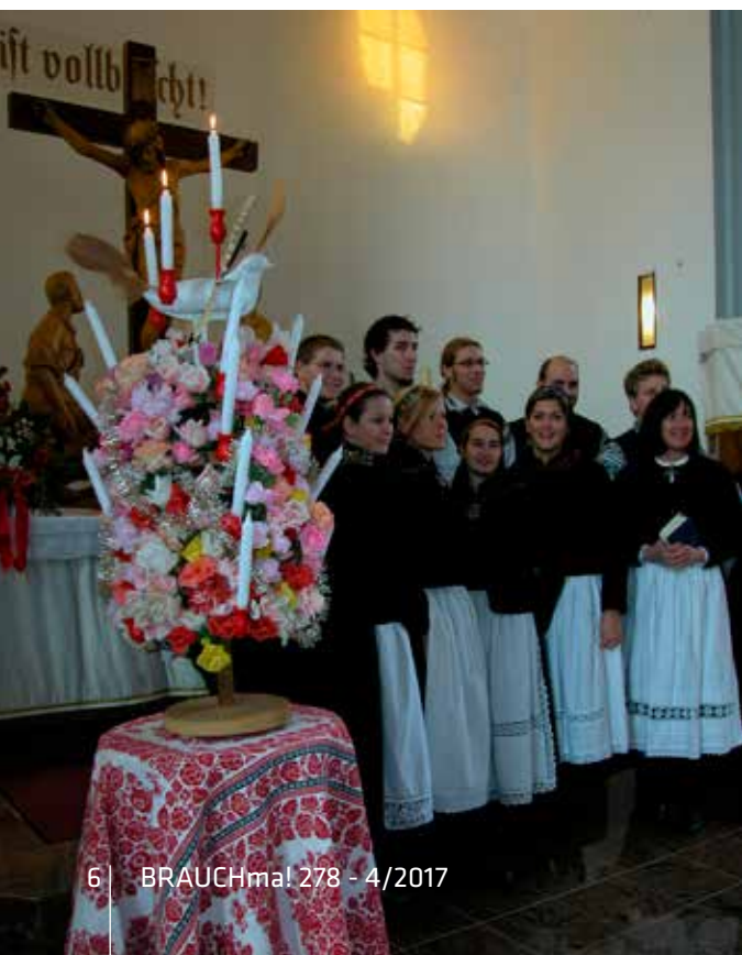
Leuchter aus Waltersdorf – er besteht gänzlich aus Papierblumen

Wenn am Christsonnabend (Heiligen Abend) zur Vesper („Vesper“ war in Siebenbürgen die Bezeichnung für den Gottesdienst am Nachmittag. Im Gegensatz zum Hauptgottesdienst am Vormittag hielt diesen in der Regel nicht der Pfarrer des Dorfes ab, sondern der Prediger) geläutet wur-