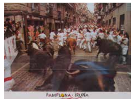
Stierläufe in Pamplona