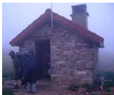
Schutzhäuser in den Pyrenäen

deutlich kürzeren Etappen, sodass ich zwei Tage später in Pamplona eintraf. Nach einem Telefonat mit meinem Sohn, der Physiotherapeut ist, entschied ich mich, hier einen Ruhetag einzulegen, damit sich meine Achillessehne erholen konnte. Ich nützte diesen Tag, um Pamplona kennenzulernen. Weltberühmt wurde diese Stadt durch die einzigartigen und haarsträubenden Stierläufe. Den Streckenverlauf dieser Stierläufe, die „Ruta de los Encierros“ abzugehen, war sehr eindrucksvoll. Nach einem Tag Ruhepause führte mich der Weg weiter über den Alto del Perdón, vorbei an einem gewaltigen Pilgerdenkmal aus zahlreichen Figuren. Von hier aus genießt man einen herrlichen Rundblick hinein in dieses schöne, weite Land. Gerade einmal zehn Kilometer weiter erreichte ich die Stadt Puente la Reina, die ihr Stadtrecht bereits Anfang