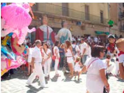
Fest in Puente la Reina

des 12. Jahrhunderts erhalten hatte. Wir schreiben den 24. Juli 2012, und genau an diesem Tag beginnt jährlich die Patronatsfeier zu Ehren von Santiago. Es schien, als wäre die ganze Stadt auf den Beinen, alle Menschen in Landestracht gekleidet – ich kam mir vor, als wäre ich in ein Volksfest geraten. Mitten in dem Gewimmel bewegten sich Riesenfiguren, die bei mir einen besonderen Eindruck hinterließen. In den Straßen und Plätzen waren massive Absperungen angebracht, die auf einen bevorstehenden Stierlauf hinwiesen. Was mir besonders imponierte, war die Fröhlichkeit der Spanier. Ich verließ die Stadt über die gleichnamige Brücke Puente la Reina, was auf Deutsch „Brücke der Königin“ bedeutet, und steuerte die nächste Herberge in Mañeru an. Eine nette kleine Herberge, die viel Geduld verlangte. Auf einem Schildchen stand