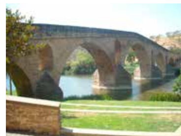
Puente la Reina