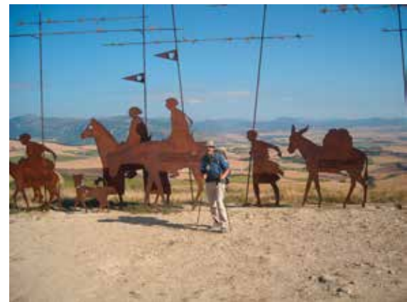
Pilgerdenkmal am Alto del Perdón