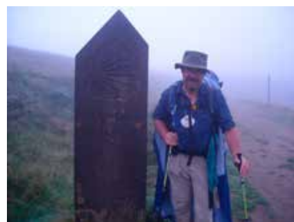
Grenzstein zu Spanien